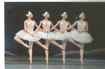
Obr. č. 10: Pas de quatre z Labutieho jazera