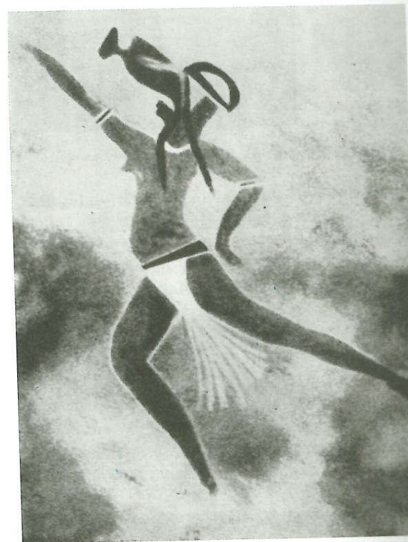
Obr. č. 1 a 2: Prehistorické nástenné malby v Tasíli-n-Ažžer - detail z veľkej kresby bohyně s rohami.

O histórii tanca sa dozvedáme z nástenných malieb ešte spred 10 000 rokov pred našim letopočtom (napr. severošpanielska jaskyňa Cogule – maľby tancujúceho muža a ženy z obdobia paleolitu). Okrem nálezov pravekých kresieb v Španielsku a vo Francúzsku, objavila výprava vedená Henrim Lhotom v roku 1956 na Sahare v Tasíli-n-Ažžer množstvo kresieb tancujúcich postáv.