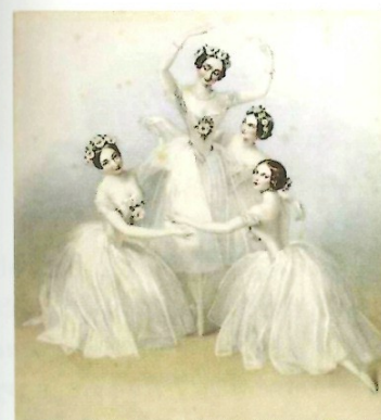
Obr. č. 9: Pas de quatre