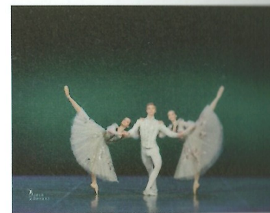
Obr. č. 7 a 8: Pas de deux a Pas de trois z Labutieho jazera