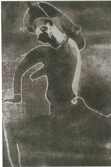
Obr. č. 2: Postava v kultickom tanci

Tieto tance sa podobali tancom domorodých kmeňov (roztrúsených po celom svete), ktoré sa tancujú aj v súčasnosti. Tanec bol už v praveku súčasťou života ľudí, odrazom ich každodenného života. Bol spojený so slovom a piesňou. Oslavovali ním narodenie, úspech z lovu, tancom zahánali i zlých duchov a démonov. Bol aj súčasťou magických obradov .